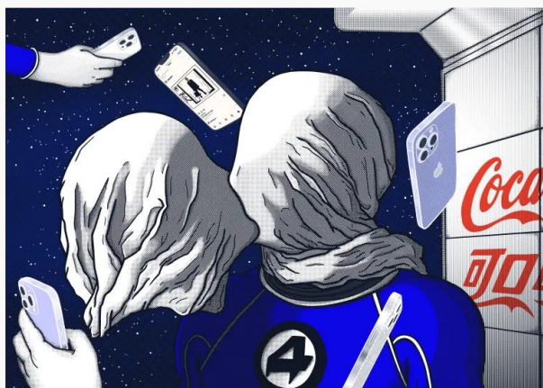
Ernest Chang 《The Lovers II》

由此作再延伸，跨媒介藝術家 Ernest Chang (張子言) 致敬馬格列特的畫作，筆下的情侶依舊是兩個蒙着頭接吻的情侶，卻變成了漫畫系列《神奇四俠》中的角色驚奇先生和隱形女俠。在親暱的擁抱之中，雙眼被蓋住了，兩人仍在滾動手機屏幕，讓人深思我們與虛擬的緊密連結，以及有關「逃離」的潛在主題——我們心目中的「逃離」，最終是否只會成為另一個將我們囚禁的「現實」？