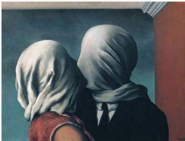
馬格列特 (René Magritte) 《The Lovers II》

比利時超現實主義畫家馬格列特的畫作《The Lovers II》，描畫一對情侶在親暱接吻，其五官卻被白布裹住，引來無限臆測，有人認為它引證了愛情的盲目，也有人覺得它表達了戀人彼此的黑暗面，即使面對最親密的人，我們也總會把一部分的自己藏起來。