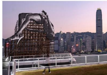
1. K11 画廊与 K11 Art Foundation 共展由美国艺术家菲莉芭·巴洛 (Phyllida Barlow) 创作的巨型艺术装置《无题：泡泡》(untitled: folly: bubbles)。2. 流离异质艺术展，由在多伦多运营的画廊 GIANTS: Rising Up，与本地独立画廊于香港上海展览中心展出，且加入香港传统“竹筒”元素，成了有异质感的艺术展。

带着迷人的目光，在展馆里凝视艺术，也将于城市的另一些地方找到瓦解矛盾特质的回应。