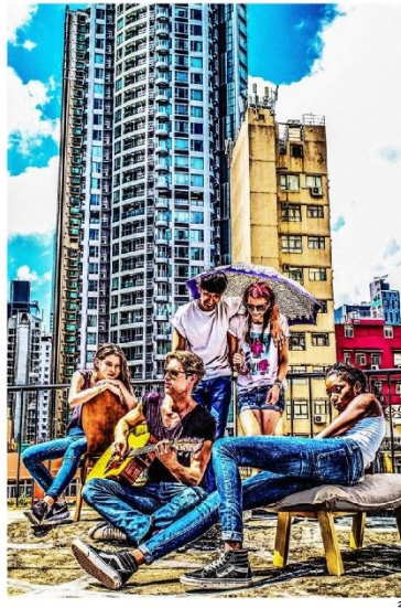
1. 熊宇晨,《Super Urban - 编号#1》,2013年,图片来自 The Stallery 2. 熊宇晨,《Super Urban - 编号#1》,2013年,图片来自 The Stallery 3. Fahah Al Qasimi,《Star Machine》,2021年,图片来自艺术家画廊 The Third Line © Fahah Al Qasimi, 2021